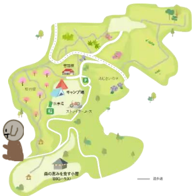
森の恵みを食す小屋 (BBQハウス)