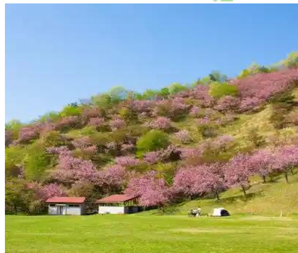
春になると桜も楽しめる！！