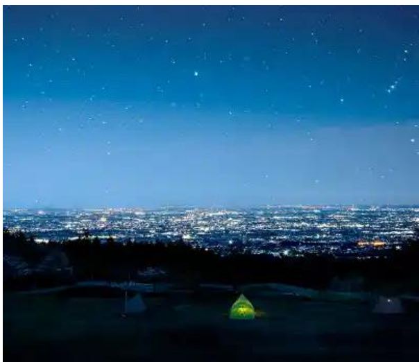
夜になると…景色がきれい！！